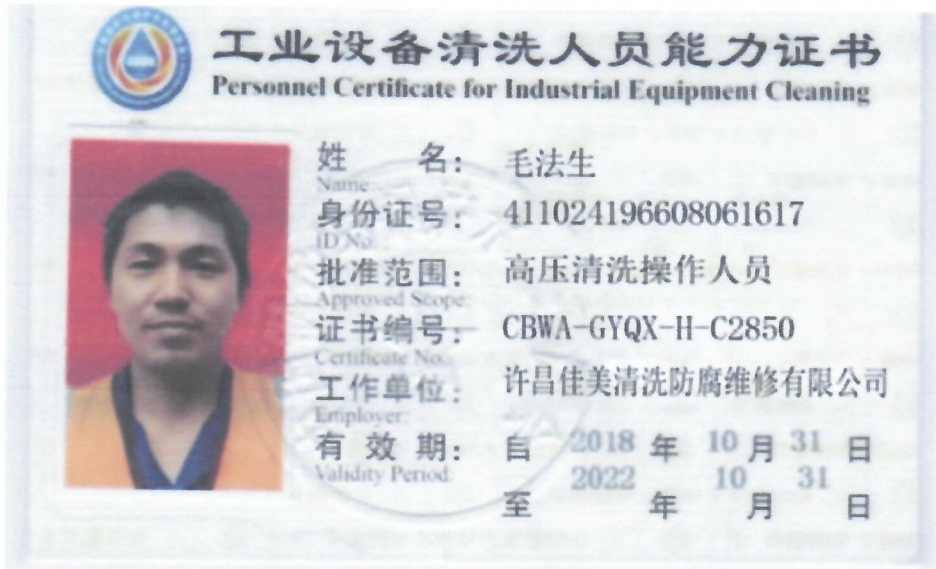
造假《工业设备清洗人员能力证书》的图片